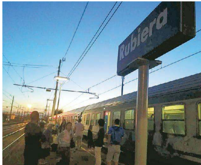
I passeggeri scesi dal treno in attesa della rimozione della salma

Tragedia nella prima serata di ieri alla stazione ferroviaria di Rubiera, dove una donna è morta travolta da un treno regionale. Il dramma si è consumato alle 21 in via della Stazione, a un centinaio di metri di distanza dalla stazione stessa, in direzione Reggio. Dalle prime informazioni la vittima è una donna di colore, che addosso non aveva documenti. Sul posto carabinieri, polfer, pompieri, ambulanza di Rubiera e automedica da Scandiano. Anche il sindaco Emanuele Cavallaro è andato a informarsi. Consistenti i disagi per i viaggiatori, che sono scesi e hanno atteso fino alle 22.30, quando - dopo il riconoscimento - la salma è stata rimossa.