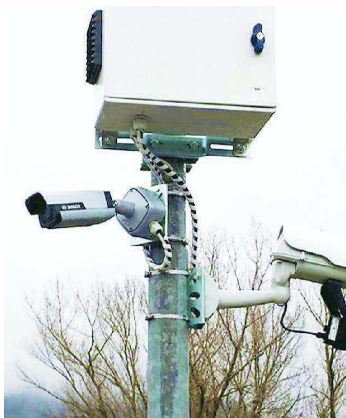
Le telecamere dotate di sistema Ocr arrivano anche a Casalgrande

LE TELECAMERE. Intanto i sistemi di videosorveglianza verranno sistemati in luoghi strategici. Le prime due telecamere saranno lungo l'ex statale, la provinciale 476R che taglia in